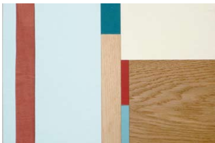
1 | 2 | 3 | 4 | 5 Anmutungsbeispiel: Cafeteria, Spital.

Noch ist wenig bekannt, dass sich mit einer wissenschaftlich gestützten Farb-, Licht- und Materialberatung in Spitälern und Heimen Kosten sparen lassen. Durch eine geringe Zusatzinvestition werden die Aufenthaltsqualität der Patienten und die Arbeitsbedingungen des Personals nachhaltig verbessert. Dies trägt dazu bei, die Gesundheitskosten und den Betriebsaufwand zu senken.