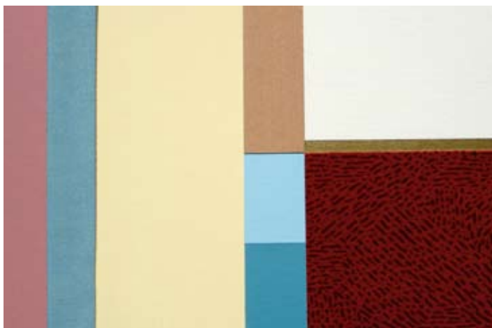
1 | 2 | 3 | 4 | 5 Anmutungsbeispiel: Esssaal, Alters- & Pflegeheim.

der Alterspflege ist auf eine gute Aufenthaltsqualität der Korridore speziell zu achten. Gerade dort, wo Demenzpatienten gepflegt werden, achtet der Farbberater darauf, dass er das richtige Mass an Farbreizen anwendet, um den Betagten Anregung und Abwechslung zu bieten und sie zur Bewegung zu animieren. Der Einsatz wilder oder monotoner Farbkombinationen könnte dagegen die Bewohner über- oder unterfordern und sich so kontraproduktiv auswirken. Bei der Materialwahl der Böden und der Planung der Lichtführung werden spiegelreflektierte Laufflächen angestrebt. Dies dient einer optimalen Bewegungsfreiheit und der Sturzprävention.