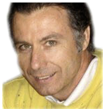
MARTIN TANNER FARBBERATUNG & DESIGN IACC/NA WWW.TANNER-FARBBERATUNG.CH

Der Besuch eines Hotels oder eines Restaurants soll für den Gast immer ein besonderes Erlebnis sein. Dieses Erlebnis setzt sich aus vorzüglichen Speisen, Getränken und einem erstklassigen Service zusammen. Ganz wichtig ist aber auch ein hochwertiges und dem Anlass angepasstes Ambiente, das eine anregende Abwechslung zum Alltag bietet. Eine durchdachte Innenraumgestaltung kann entscheidend dazu beitragen, dass sich ein Gastbetrieb von den Mitbewerbern positiv abheben kann. Bei der Planung von Um- oder Neubauten sowie bei der Erneuerung der Inneneinrichtung empfiehlt sich daher der rechtzeitige Beizug von Fachleuten wie Farbberatern oder Farbdesignern. Eingriffe in die Innenraumgestaltung bekommen immer auch eine strategische Bedeutung. So ist unbedingt