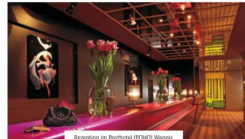
Rezeption im Posthotel (POHO) Weggis.