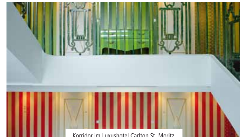
Korridor im Luxushotel Carlton St. Moritz.